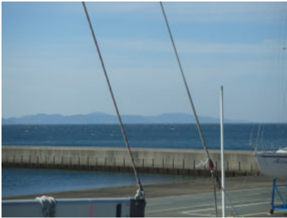
(強風が吹いていました)

なお3月ポイントレースの代替レースとして8月19日の理事長杯レースを利用する事に決定いたしました。理事長杯のレース結果を年間ポイントとして加算いたします。