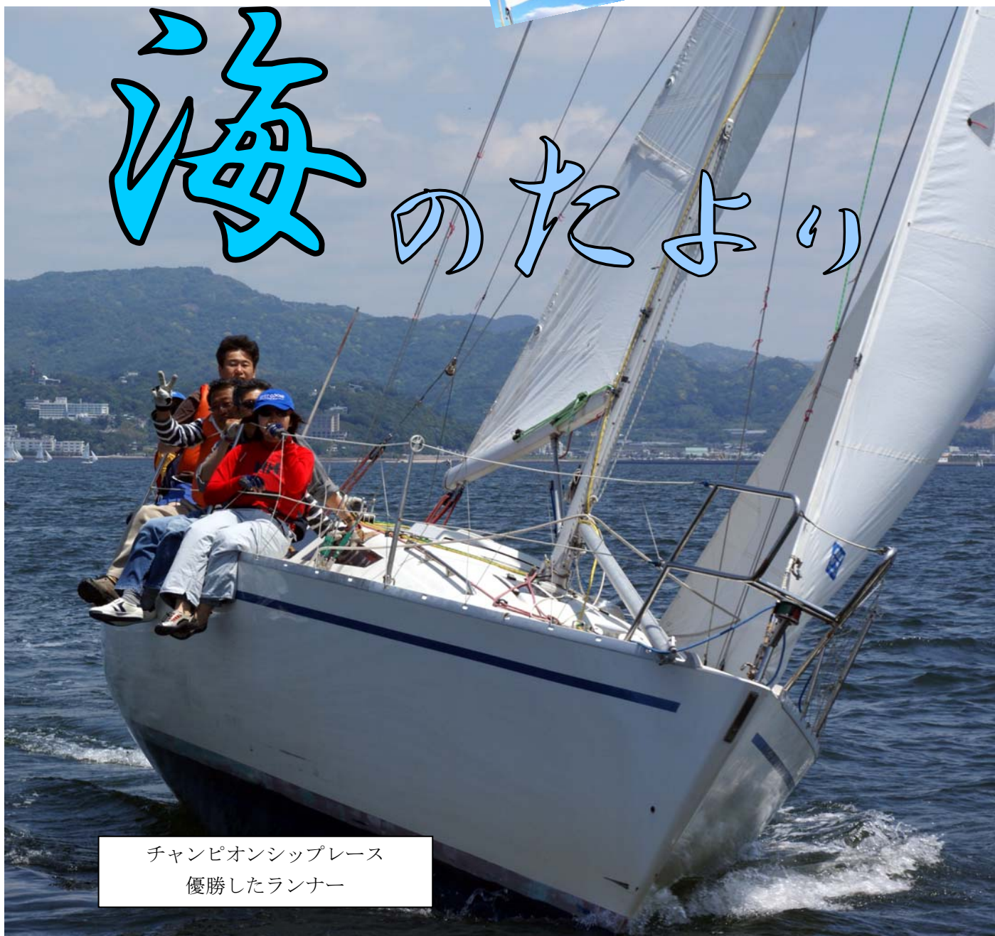
チャンピオンシップレース 優勝したランナー