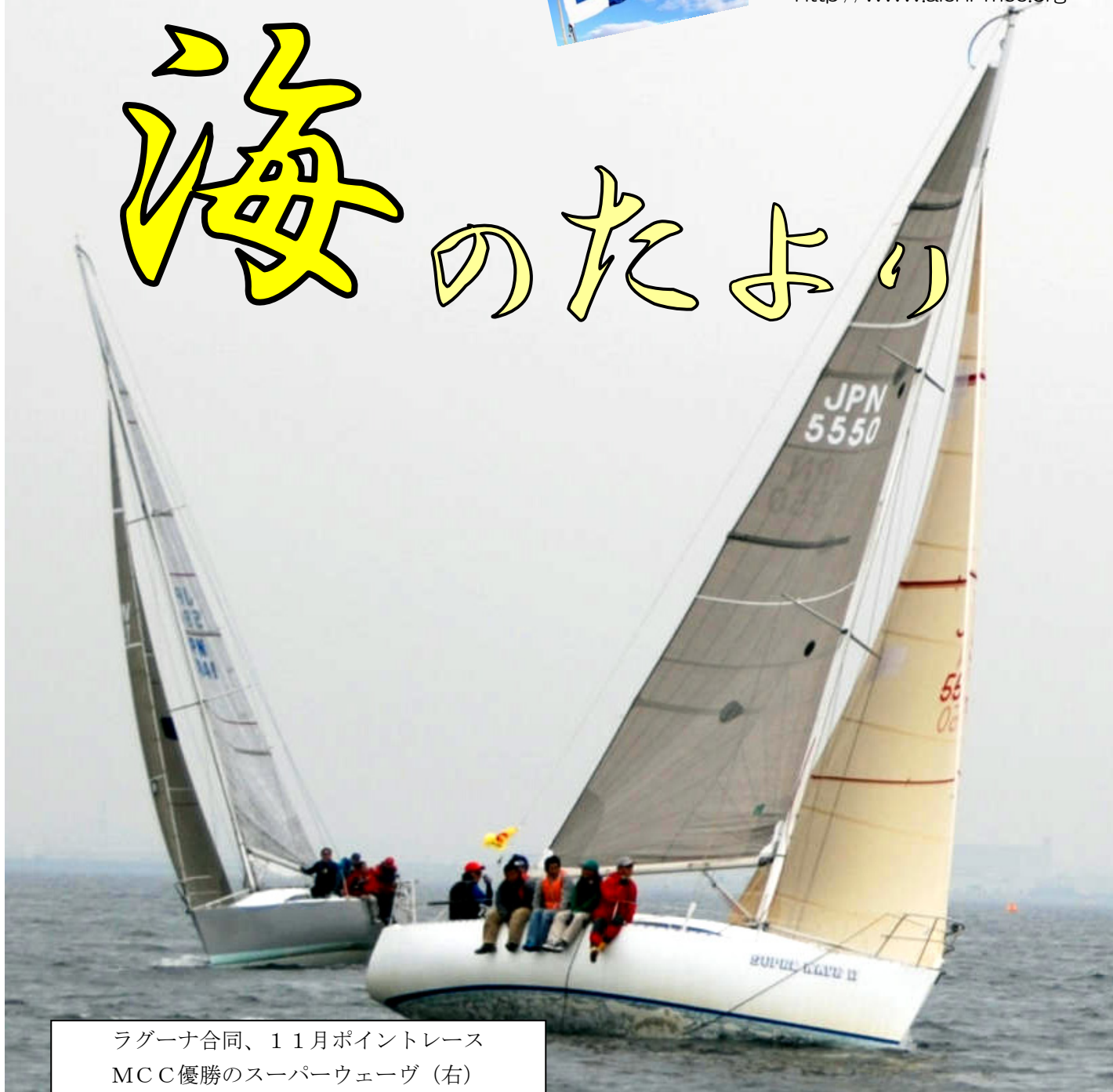
ラグーナ合同、11月ポイントレース MCC優勝のスーパーウェーブ (右)