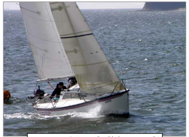
下マークをトップ回航するホープ

ホープチームは今シーズン、エリカカップ「クラス優勝」 蒲郡マリンカップ「クラス優勝」 理事長杯「総合2位」「スモールクラス優勝」 デニスコーナーカップ「クラス3位」今日の最終レースでスモール年間総合優勝と充実したシーズンでした。 来シーズンもよろしくお願ひします。