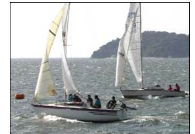
熱戦を展開したスモールレース最終戦

MCC海のたより12月号・MCC海のたより12月号・MCC海のたより12月号・MCC海のたより