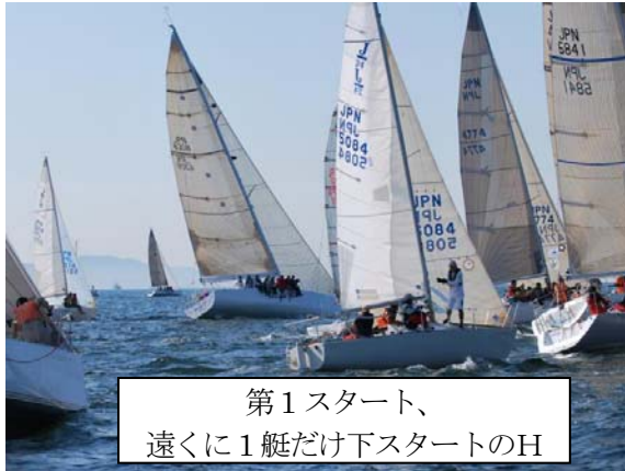
第1スタート、 遠くに1艇だけ下スタートのH

1レース目はホーネットが唯一一スタートで出し抜いたつもりであったがはずれ、それでもまずまずのところへ、上マークではわずかに同型艇ロクやアルミスに先行を許す程度であったが、その後のスピンランで理解できない程の失速をしてしまった。スピンシートやポールなどトリムの良さあしもあったが、フリーの走りでの位置取りの悪さやコースの読みもできず戦略がなかったことを反省。