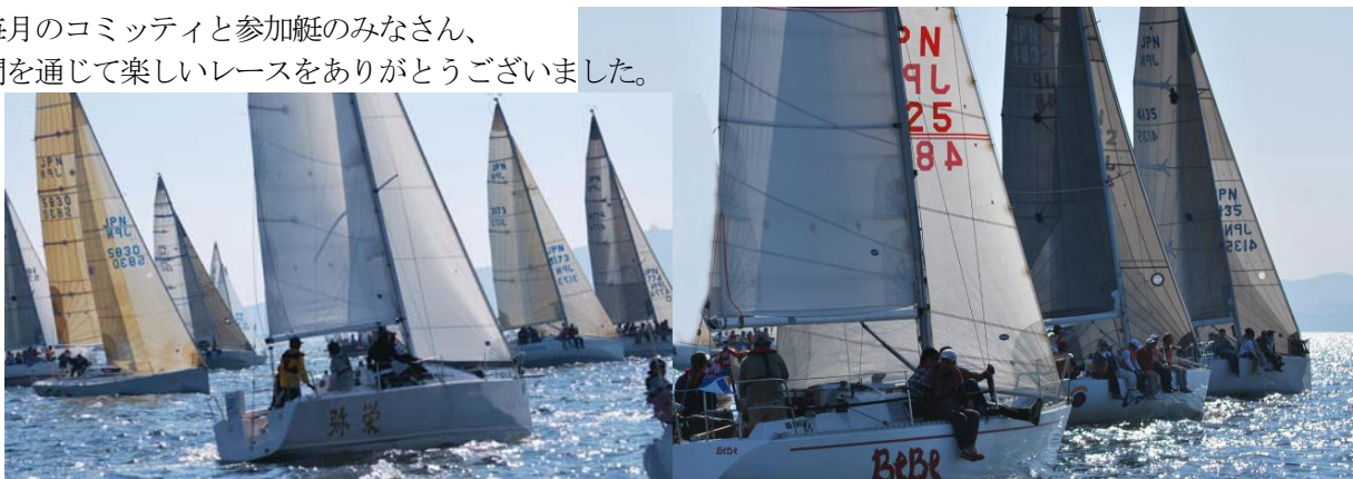
第2スタート、右から上1スタートのダンリュウ、オデッセイ、ベベ、アルミス、セレスティス、弥栄 左端がホーネット、右にタックしたシーファルコン。この後、ホーネットもタックし右海面へ出た。ホーネット、その後は風の触れを良く捉え着順5位、総合2位を得た。

毎月のコミッティと参加艇のみなさん、年間を通じて楽しいレースをありがとうございました。