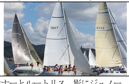
スタート、左アルミス、ランナーとルートリス、影にジュノー