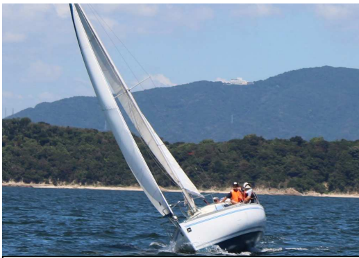
新ジュノー Auklet26 第 1 マーク前

もう一つのミス、スピンハリヤードのナスカンが外れずペンチを用意したりするあいだにマークをオーバーしてしまい余分な走りをしてしまった。最後のレグは順調に走りスピードも出たので、楽しいレースでした。