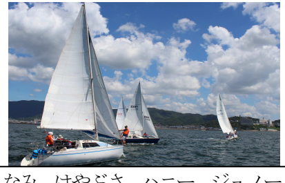
スタート前右からうらなみ、はやぶさ、ハニー、ジュノー