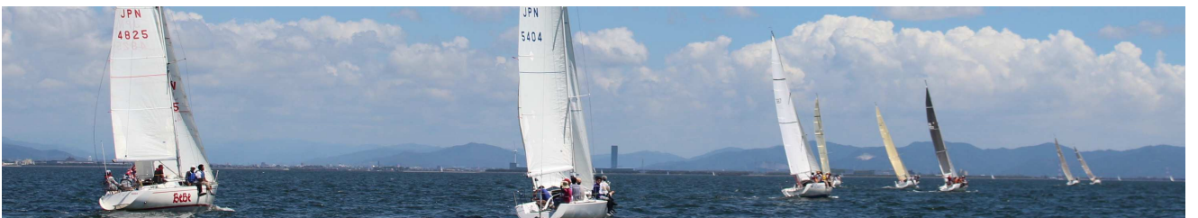
スタート後、左からベベ、ウラナミ、ランナー、ダンシング、セレス、オデッセイ、ウェーブ?、アルミス?