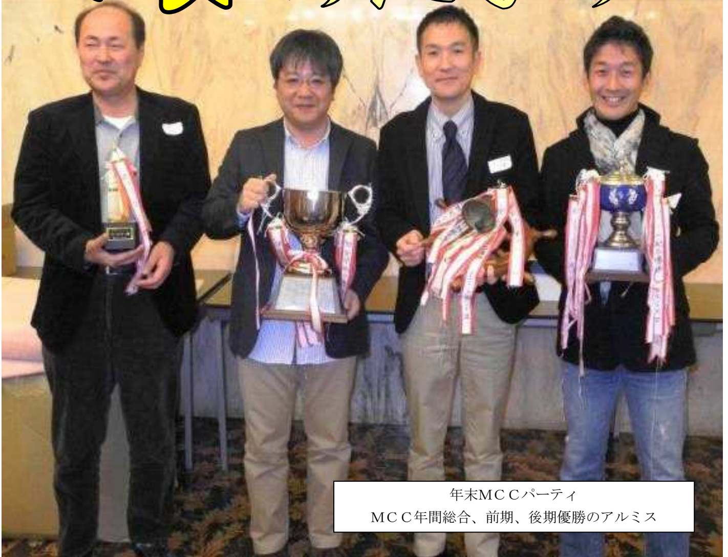
年末MCCパーティ MCC年間総合、前期、後期優勝のアルミス