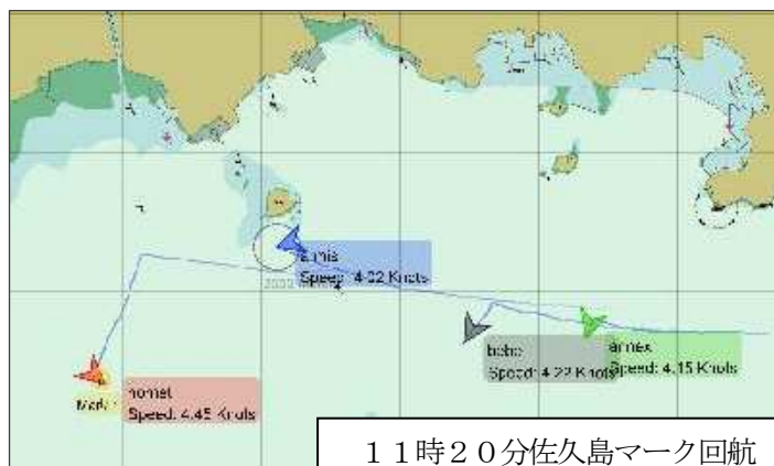
11時20分佐久島マーク回航