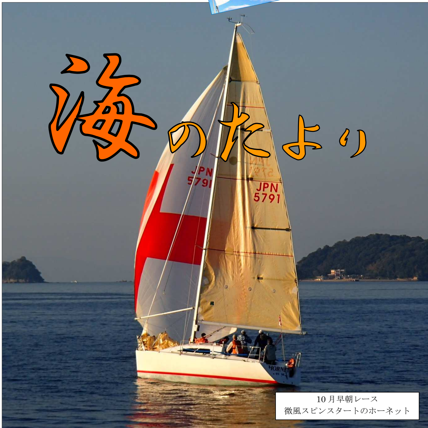
10月早朝レース 微風スピンスターートのホーネット