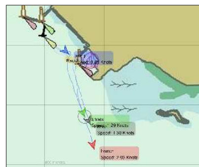
7時10分、アルミスのスタート時

13時31分フィニッシュ、アルミスが気になり、しばらく待機するが風が少し落ち遅れている。安心して入港した。これで年間総合3連覇達成できた。